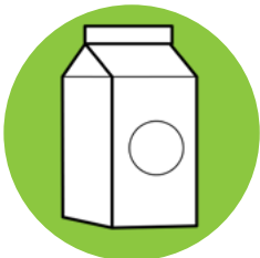
Embalaje de Alimentos